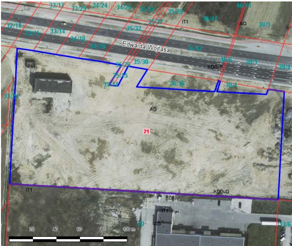
Fot. Lokalizacja Nieruchomości przy ul. Stefczyka.